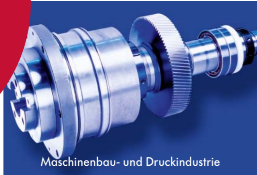
Maschinenbau- und Druckindustrie

Individuell Zuverlässig Robust Effizient Innovativ